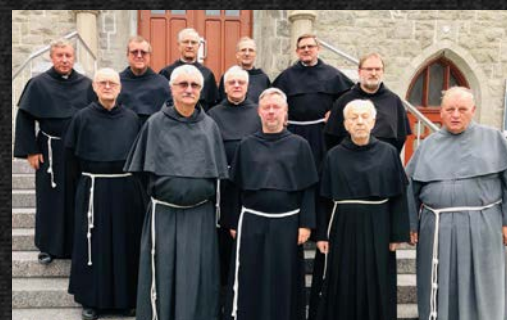
KAPITUŁA KUSTODII KANADYJSKIEJ

Ukazała się nowa płyta franciszkańskiego zespołu Pokój i dobro pt. „Bracia Wilcy”, na której znalazło się 10 utworów różnorodnych gatunkowo.